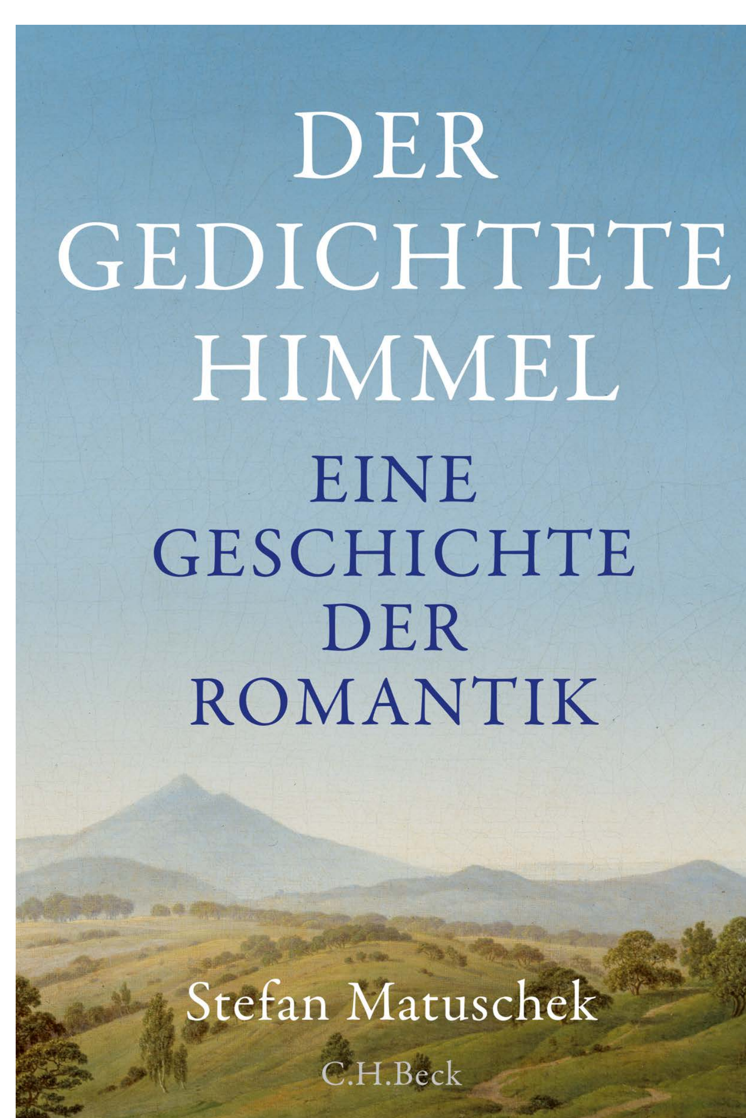
Buchcover des auszuzeichnenden Werks